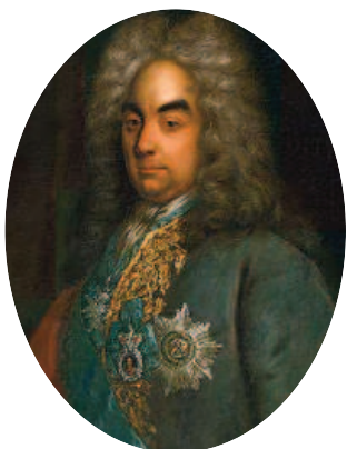
Петр Андреевич Толстой