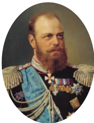
Император Александр III