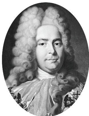
Генерал-прокурор Павел Иванович Ягужинский