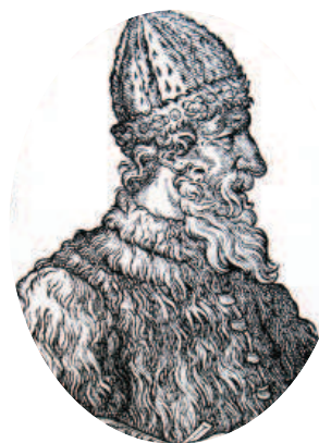
Великий князь Иван III

До XVIII века чиновники на Руси жили благодаря так называемым «кормлениям», то есть, при отсутствии оклада за исправление должности, разрешению на подношения от заинтересованных в их деятельности лиц. Одаривали их не только деньгами, но и «натурой» — мясом, рыбой, пирогами и пр., что было делом обыкновенным.