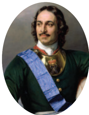
Император Петр I

Сообщениями «о похищении казны» первоначально занималась тайная канцелярия во главе с графом П.А. Толстым. И работала она на совесть. Но были и такие дворяне и чиновники, которые к проблеме мздоимства относились гораздо терпимее. По рассказам современников, однажды в Сенате Петр пригрозил издать указ, по которому всякий, кто украдет у казны сумму, на которую можно купить веревку, будет повешен. Генерал-прокурор Ягужинский на это заметил: «Неужели вы хотите остаться императором без служителей и подданных? Мы все воруют — с тем только различием, что один больше и приметнее, чем другой».