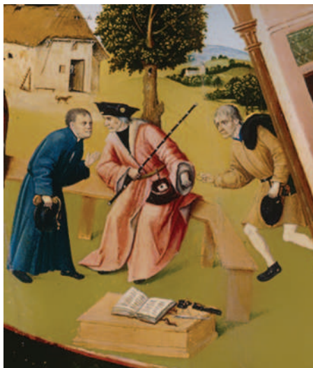
Фрагмент «Алчность» картины Иеронима Босха «Семь смертных грехов»

Рассматривая участников коррупции на примере взяточничества, стоит отметить, что в коррупционном процессе всегда участвуют две стороны. Одна сторона — это взяткополучатель (подкупаемый). Вторая сторона — это взяткодатель (осуществляющий подкуп). Также в процессе может участвовать и третья сторона — посредник.