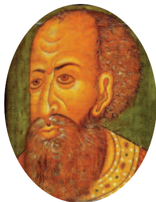
Царь Иван IV Грозный